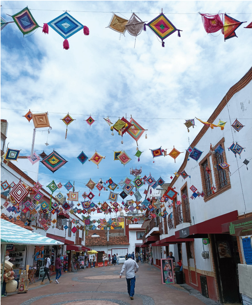
Fotografía: Cielo de Morelia (García, 2022).