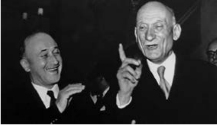
Figura 11. Jean Monnet y Robert Schuman, padres fundadores de la integración europea