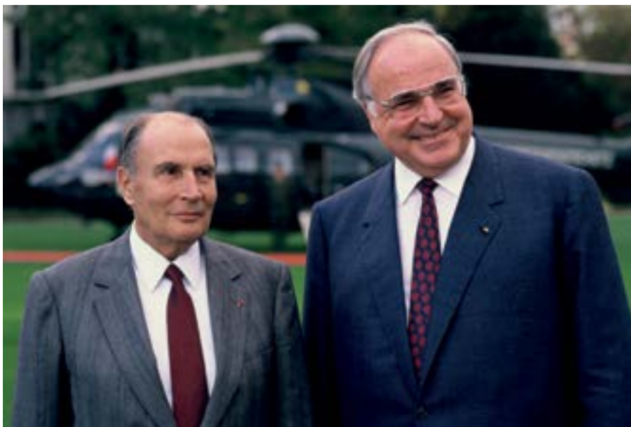
Figura 17. François Mitterrand y Helmut Kohl en Bonn, Alemania, noviembre de 1989

Nota: tomada de Bundeskanzler-Helmut-Kohl-Stiftung (s. f.).