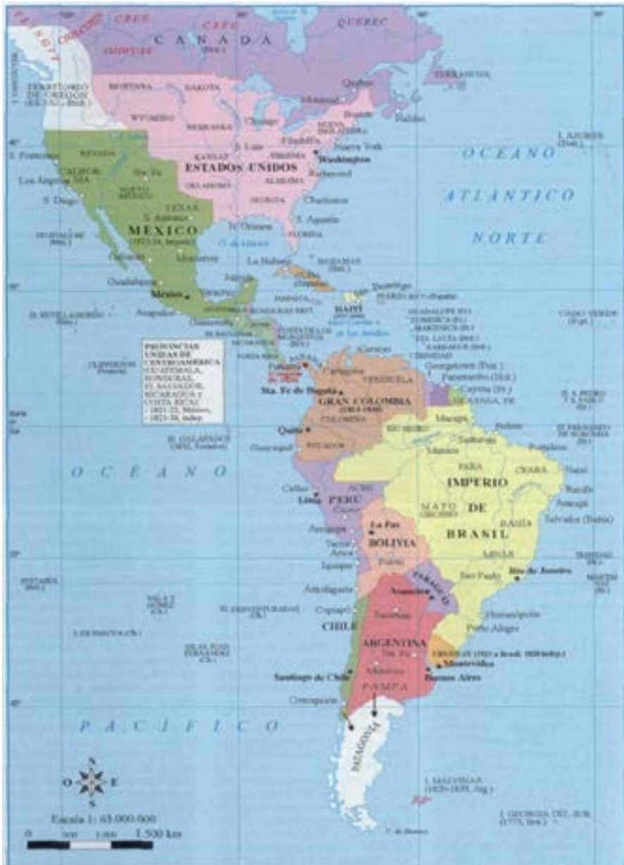
Figura 1. Iberoamérica en 1826

Nota: tomado de López y Larrea (2022, p. 62).