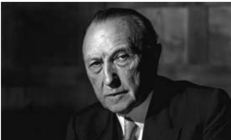
Figura 16. Konrad Adenauer

Konrad Adenauer es una de las figuras más notables de la historia europea. Para él, la unidad europea no solo significaba la paz, sino también el modo de reintegrar la Alemania de posguerra en la vida internacional. Europa no sería como la conocemos en la actualidad sin la confianza que logró generar en otros Estados europeos mediante la coherencia de su política exterior. En 2003 sus compatriotas le nombraron “el alemán más grande de todos los tiempos”. (pp. 5 y 6)