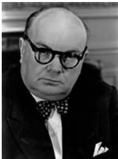
Figura 15. Paul-Henri Spaak