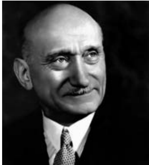
Figura 13. Robert Schuman