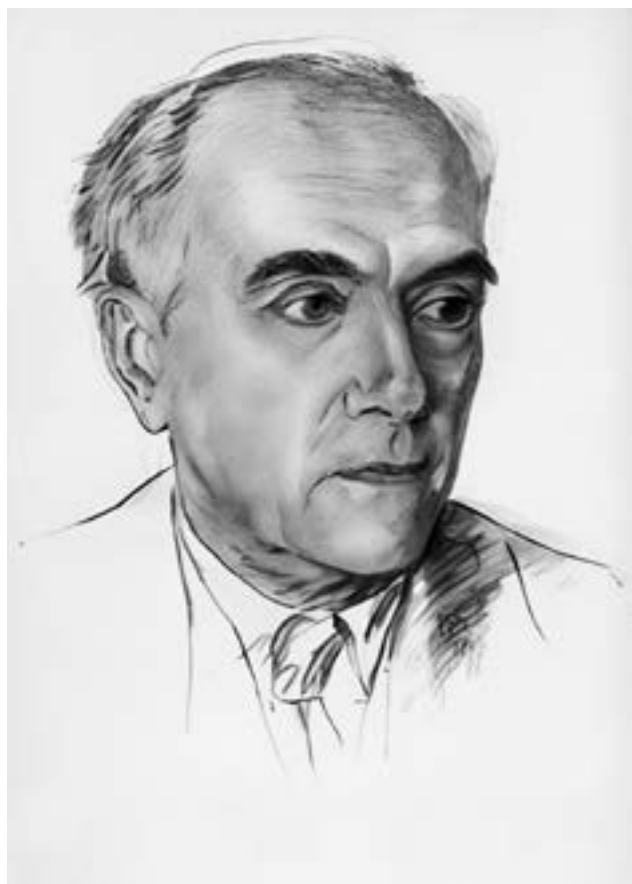
Figura 20. Retrato de David Mitrany