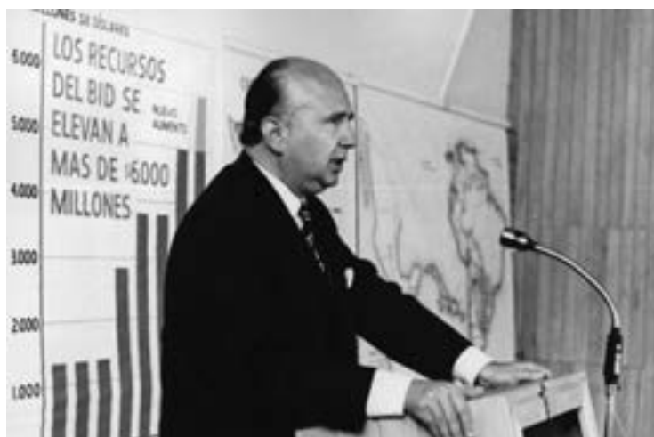
Figura 4. Felipe Herrera Lane

Nota: tomada de Wikipedia (2024, 17 de septiembre).