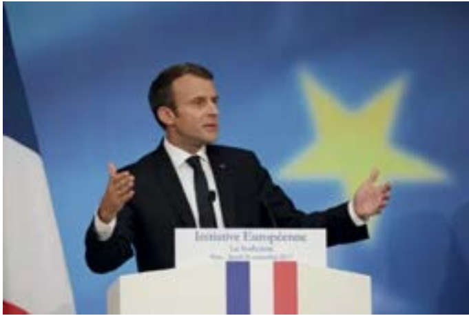
Figura 19. Emmanuel Macron en la Universidad de La Sorbona