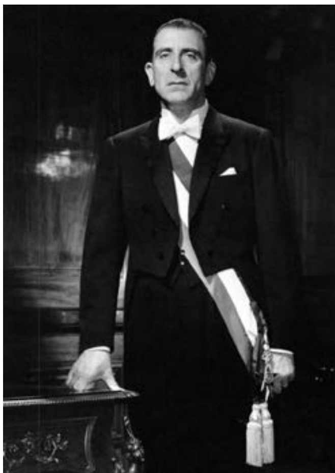
Figura 10. Eduardo Frei Montalva