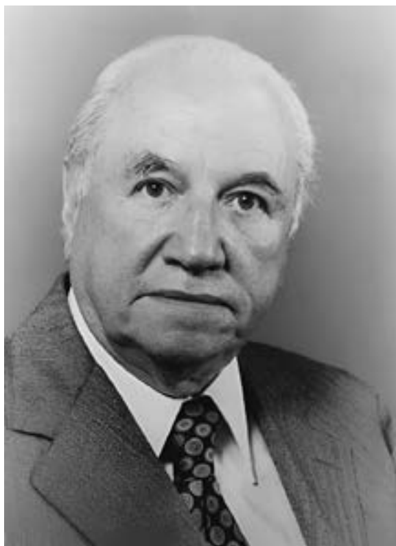
Figura 2. Raúl Prebisch