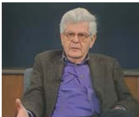
Figura 21. Ernst Haas

grupos de interés regionales y la burocracia de las organizaciones regionales. Aunque los estados miembros crean las condiciones iniciales, los grupos de interés regionales y la burocracia internacional permiten que el proceso continúe, y los gobiernos nacionales resuelven cada vez más sus conflictos de intereses otorgando más autoridad a las organizaciones regionales.