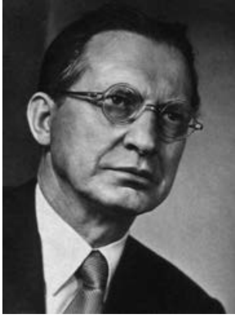
Figura 14. Alcide De Gasperi