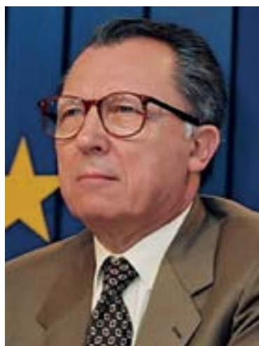
Figura 18. Jacques Delors como presidente de la Comisión Europea