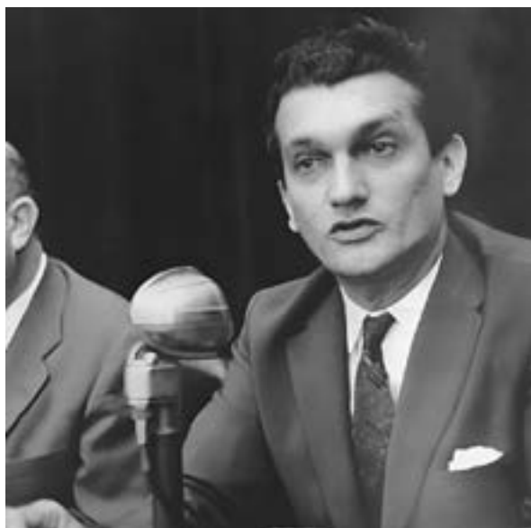
Figura 3. Celso Furtado