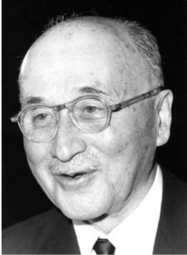
Figura 12. Jean Monnet