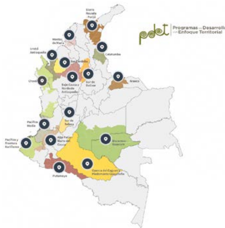
Figura 1. Subregión PDET del sur del Tolima